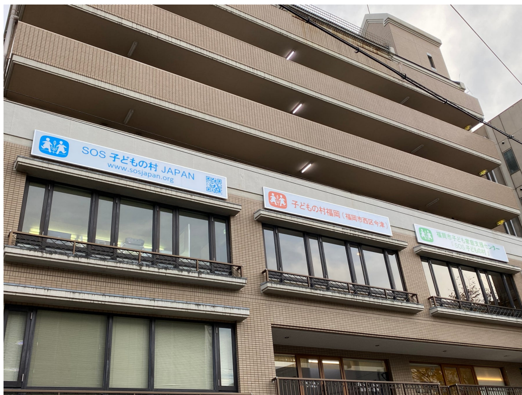
SOS子どもの村JAPAN 赤坂事務局

「親と離れて暮らす子どもたちを養育するだけでなく、子どもと家族が離れることなく、安心して地域で暮らすことができるしくみを作りたい」との想いから、福岡市の委託を受け「児童家庭支援センター SOS子どもの村」を福岡市中央区赤坂で運営しています。