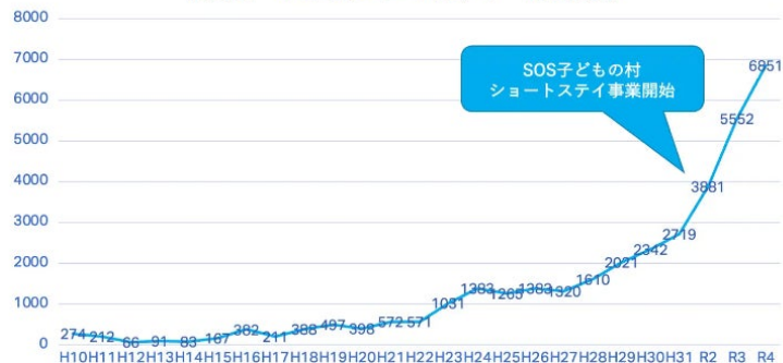
福岡市 子どもショートステイ 利用実績

虐待予防の取り組み - Family strengthening program -