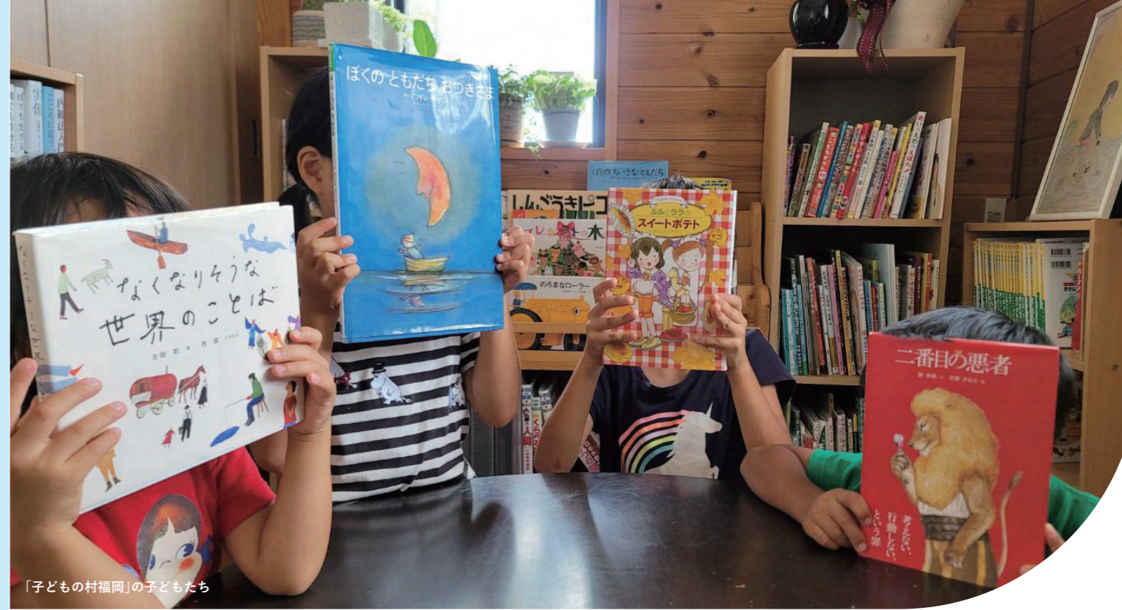
「子どもの村福岡」の子どもたち